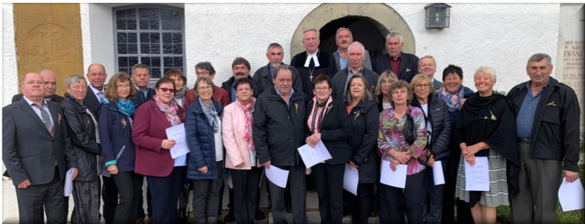
Goldene Konfirmation in Forheim