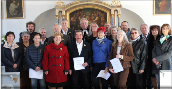
Goldene Konfirmation in Aufhausen

Zu den goldenen Konfirmationen in Aufhausen (22.10.2023), Forheim (15.10.2023) und Unterringingen (24.09.2023) waren die Jahrgänge 1968 bis 1973 eingeladen um mit Dekan Wolfemann zu feiern.