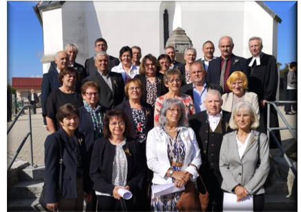
Goldene Konfirmation in Unterringingen