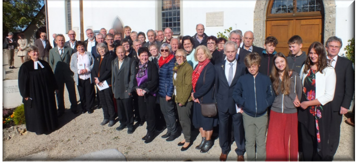
Von damals 67 sind leider acht bereits verstorben - 36 feierten mit!

(vorne rechts: Die zwei jungen Damen wurden 2023 konfirmiert, sie überreichten zusammen mit einem Konfirmanden 2024 den Jubilarinnen und Jubilaren charmant die Urkunden)